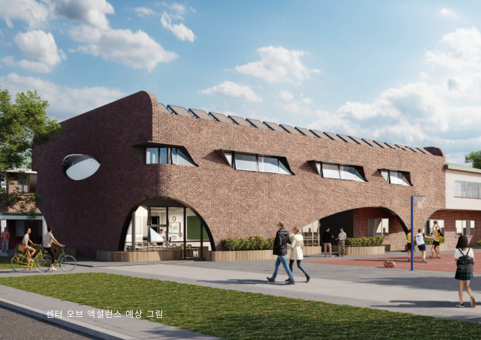
센터 오브 엑셀런스 예상 그림